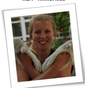
Tante Hannah K3A - Bijtjesklas