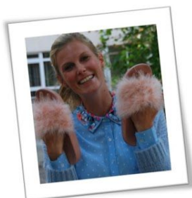
Tante Laura K0 - Giraffenklas