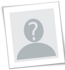
Juf Ria Ondersteuning L1 – L2 – L3