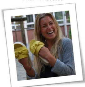
Tante Jill K3A – Bijtjesklas (a.i.)