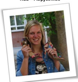
Tante Nancy K3A - Bijtjesklas