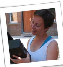
Juf Lot Administratie