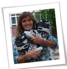
Tante Leen K1A - Kikkerklas