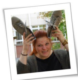
Tante Lois K2A - Lieveheersbeestjesklas